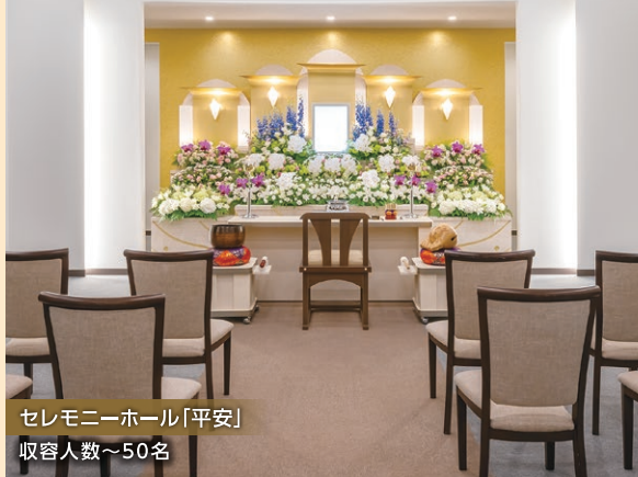
セレモニーホール「平安」 収容人数～50名