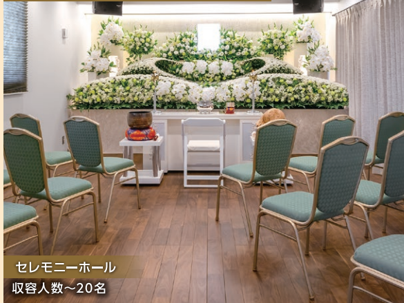
セレモニーホール 収容人数～20名