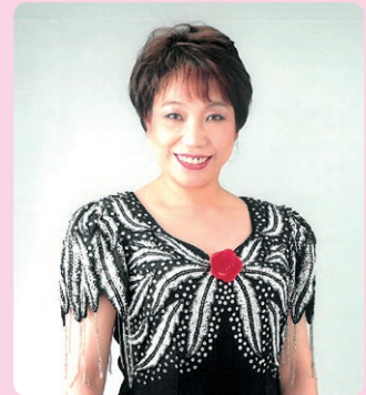
北山 さち プロフィール

大田原市(旧黒羽町)出身の演歌歌手 平成9年デビュー 平成11年キングレコード ヒット奨励賞受賞