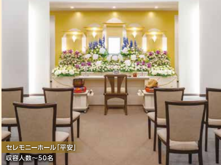
セレモニーホール「平安」 収容人数～50名