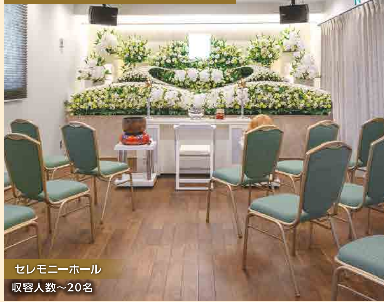
セレモニーホール 収容人数~20名